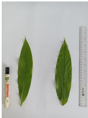
Gambar 2. Daun Tanaman Kunyit Kecamatan Kamal (Kiri) dan Kecamatan Bangkalan (Kanan)