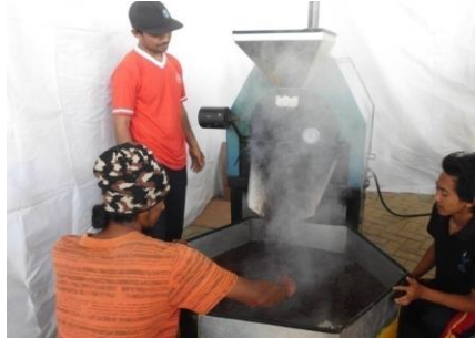
Gambar 6. Menggoreng kopi dengan mesin dan Blower Pendingin Korengan Kopi

keadaan 145' C Turun Menjadi 140' C merangka naik suhu panas mencapai 145°C dengan lama penggorengan selama 31 Menit