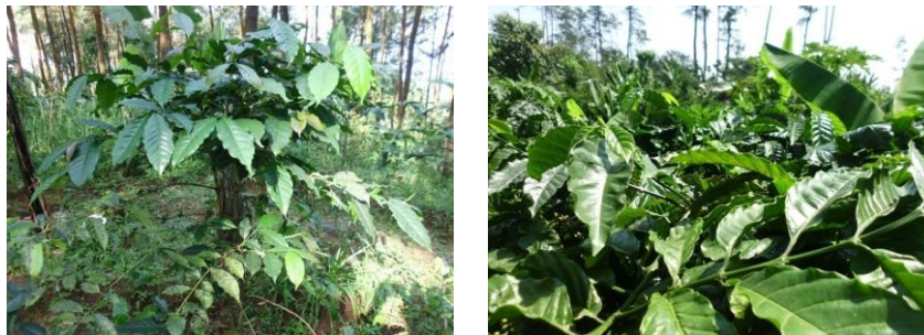
Gambar 3. Pohon Kopi yang baru berbuah

Ada juga Kopi yang baru belajar berbuah dan kopi tersebut baru berumur sekitar tiga tahun dan dua tahunan dan ini berjajar di Desa Jatiarjo, Desa Dayurejo, Kelurahan Ledug serta Kelurahan Pecalukan hampir semua Desa Ada, Contoh Gambar :