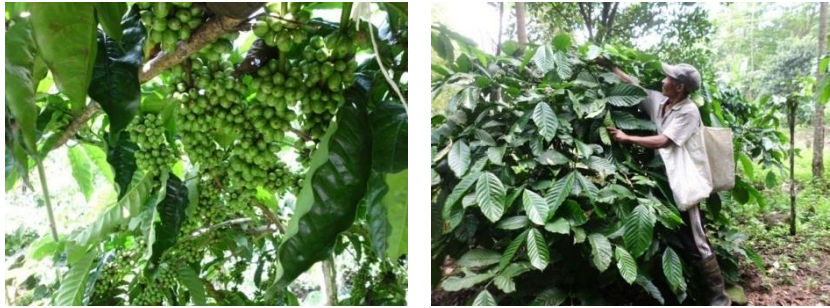
Gambar 2. Kondisi Buah Kopi di Lereng Gunung Arjuno

Penanaman kopi di Kelurahan Ledug, Kelurahan Pecalukan dan sebagian Kecil di Desa Jatiarjo Maupun Desa Dayurejo di lakukan pada tahun 2009 dari hasil surve di lapangan ada tanaman yang sudah pohonnya besar dan sebagian besar di lakukan penyambungan agar mendapatkan hasil yang maksimal, Contoh gambar bawah :