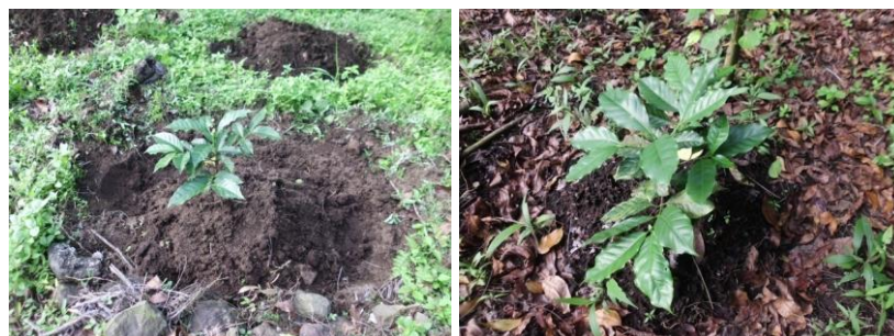
Gambar 4. Foto Tanaman kopi baru tanam

terhampar di wilayah Tahura R. Suryo dan sebagian di LMDH di dua Desa dan dua Kelurahan di atas.