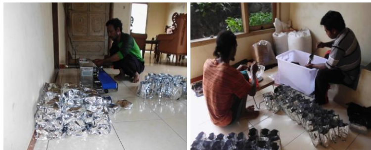
Gambar 8. Penyolekan/Pengemasan Bungkus Kopi serta Pengisian dan Penimbangan

biasa, dan bagi yang Kopi Murni Sepesial Rp 15 000 dengan berat 2 [ dua ] On