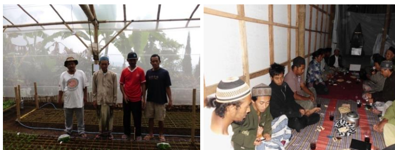
Gambar 5. Suasana penguatan kapasitas petani kopi

Kedua, penataan administrasi organisasi kelompok tani dengan membentuk AD/ART kelompok tani kopi, serta pembuatan Akte Notaris dan Badan Hukum Kelompok Puspa Tani Makmur di DEPHAM RI. Ketiga, pengembangan olahan produksi kopi, sampai dengan pengemasan yang sudah dilengkapi dengan PRT dari dinas kesehatan. Keempat, tata kelola administrasi keuangan dalam usaha budidaya dan olahan kopi.