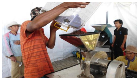
Gambar 7. Penggilingan Kopi Kolompok Kopi Puspa Tani Makmur

Penggilingan Bubuk Kopi Halus siap saji Dengan Kapasitas Kopi sebesar 10 Kg penggilingan dilakukan selama 12 s/d 14 menit. Pelatihan selesai Jam, 13,45 Wib dengan