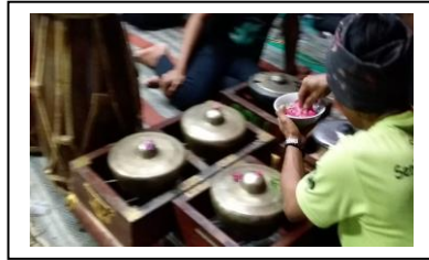
Gambar. 5. Air Kembang di Percikan