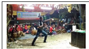
Gambar.7. Seorang Pria Penonton Pria Menampilan Pencungan Ibing Penca