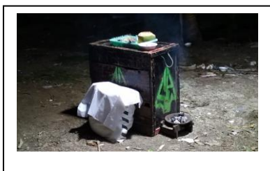
Gambar. 1. Perlengkapan Sejaji diatas Peti Gambar.2. Sesaji diatas Peti

Jenis-jenis sesaji yang biasa disediakan dalam pertunjukan Topeng Banjet Abah Pendul ini adalah: Gabah, Ayam bakar bakakak dalam karung ditutup kain putih, Tempat pembakaran kemenyan, rujak-rujukan, air, pisang, kue-kue, kolak pisang, beras, kelapa muda, telur ayam, rokok, daun pandan, air dan kembang bunga.