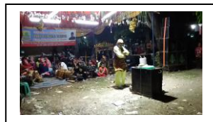
Gambar.11. Pelawak Pria