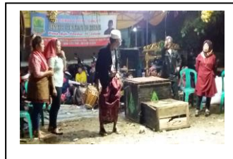
Gambar: 13. Adegan suasana di mulainya lakon cerita berlangsung

Kostum yang dipakai disesuaikan dengan peran yang dibawakan dan rias karakter dilakukan dengan sendiri sesuai karakter peran masing-masing yang akan tampil.