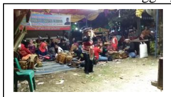
Gambar.9. Penari Ronggeng