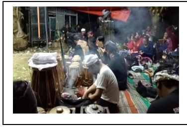
Gambar.3. Persiapan ngukus