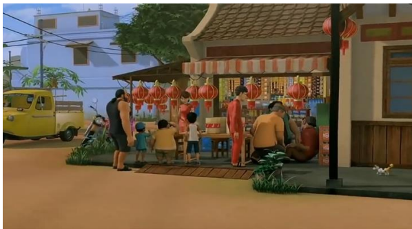
Gambar 5. Toleransi antaragama