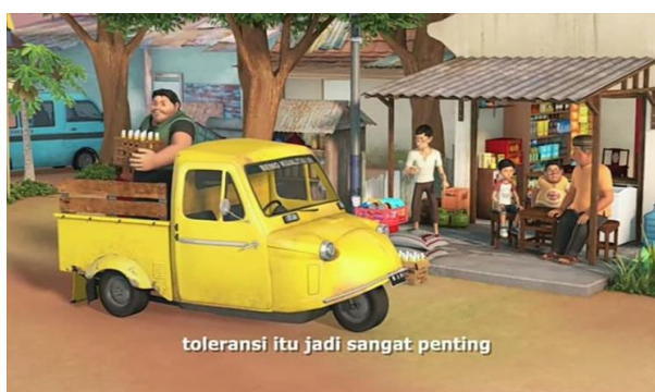
Gambar 3. Pentingnya Toleransi