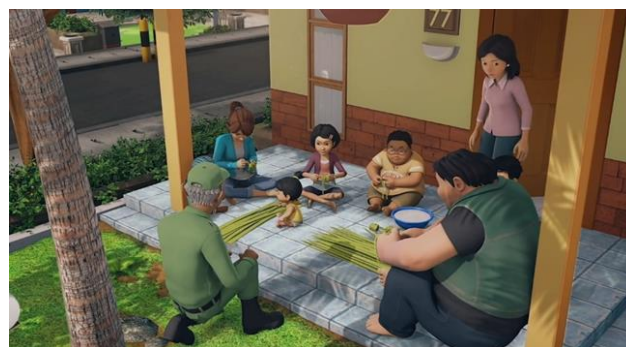
Gambar 6. Membuat Ketupat bersama

sangat penting dalam kehidupan masyarakat kita dengan begitu besarnya keragaman budaya yang kita miliki. Jika tidak ada sikap toleran dalam kehidupan bermasyarakat, maka akan menimbulkan salah paham antar budaya, yang akan berujung pada salah paham dalam masyarakat dapat menimbulkan konflik.