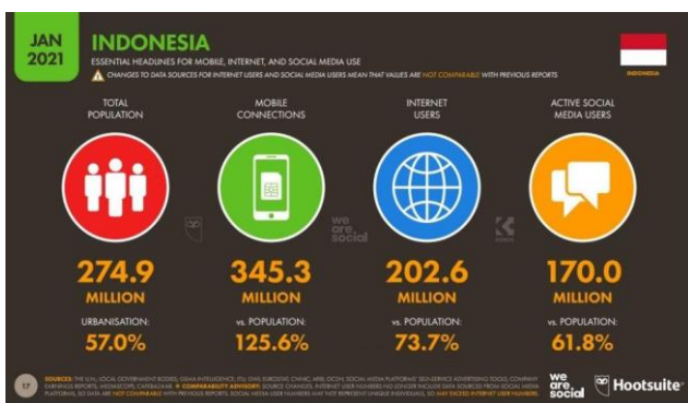
Gambar 1. Grafik pengguna Internet di Indonesia, 2022

Dari pengertian di atas kita dapat simpulkan bahwa internet merupakan akses tanpa batas, yang mempermudah untuk berkomunikasi baik antar individu atau kelompok dan juga memberikan kebebasan bagi para penikmatnya. Menurut hasil survei yang dilakukan oleh We Are Social, jumlah pengguna internet di Indonesia per Januari 2022 mencapai 204,7 juta, jumlah itu naik tipis 1,03% dibandingkan tahun sebelumnya yakni 202,6 juta pada Januari 2021.