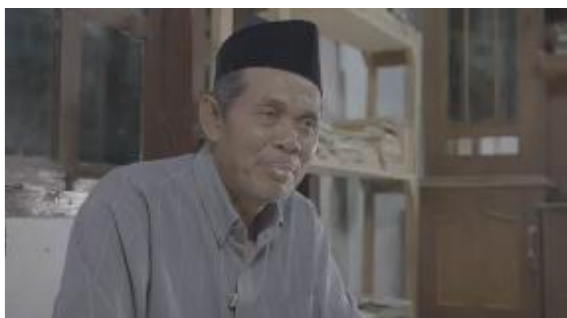
Gambar 4. 7 Visual Pemuka Agama

Visual wawancara dengan pemuka agama, dimana narasumber menyampaikan statement tentang keberadaan santet di Banyuwangi memang nyata, dia juga menjelaskan kalau ilmu santet memang dilarang di mata agama, karena menurut agama orang yang memiliki ilmu santet pasti memiliki hati yang hasut atau jelek.