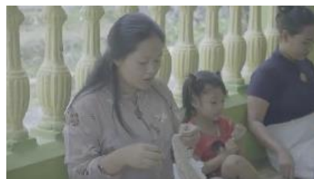
Gambar 4. 10 Ibu-ibu menjahit monte

Sequence 2 pada program feature televisi “Another Side” edisi “Jejak Santet di Banyuwangi” membahas tentang pertemuan mistis ditengah tradisi yakni bagaimana awal mula santet muncul dan di normalisasikan dalam kehidupan masyarakat Osing. Pada sequence ini produser berkreasi terdapat ambience warga asli Osing pada opening, dilanjut narasi, ilustrasi dan wawancara. Dengan durasi yang lebih lama dibandingkan dengan sequence 1.