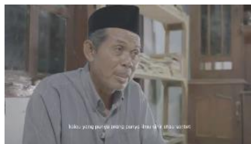
Gambar 4. 1 Cuplikan narasumber pemuka agama

Sebelum masuk ke id’s program diawali dengan eye catcher yang bertujuan untuk mengundang minat audience . Visual yang disajikan di dalam eye catcher diambil dari beberapa potongan visual di beberapa sequence dan juga sound nature dan atmosphere dari visual kesenian barong hal ini bertujuan agar audience yang menonton merasakan sensasi yang mencekam.