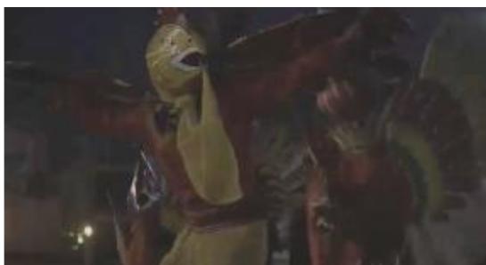
Gambar 4. 11 Pertunjukan kesenian

Visual barong seperti gambar diatas sebagai kombinasi visual opening pada sequence ini, hal ini selaras dengan pernyataan dari narasumber yang membahas kesenian barong di beberapa part.