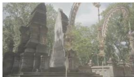
Gambar 4. 9 Pura Alas Purwo

Visual diatas menjelaskan tentang ibadah yang dilakukan oleh seseorang yang memiliki ilmu santet atau sihir memang sempurna secara jasmani namun belum tentu diterima oleh yang maha kuasa. Dalam sequence 1 hanya berfokus pada satu narasumber dari pemuka agama, hal ini bertujuan agar audience memahami terlebih dahulu bahwa santet memang ada dan dilarang di mata agama.