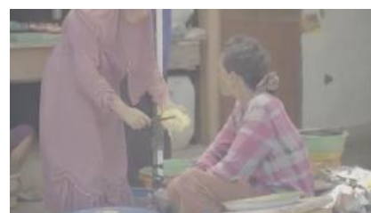
Gambar 4. 6 Orang osing berinteraksi

Masuk pada sequence 1 berfokus untuk membahas tentang makna santet Banyuwangi di mata agama, hal ini bertujuan untuk menjawab stigma masyarakat tentang santet di Banyuwangi. Aspek kreatif yang dikembangkan pada sequence satu ini cukup beragam. Mulai dari penayangan visual dengan atmosphere yang dikombinasikan oleh narasi dan musik ilustrasi, terdapat wawancara, dan ditutup dengan narasi pada akhir sequence .