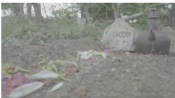
Gambar 4. 8 Petilasan

Visual wawancara dengan pemuka agama, dimana narasumber menyampaikan statement tentang keberadaan santet di Banyuwangi memang nyata, dia juga menjelaskan kalau ilmu santet memang dilarang di mata agama, karena menurut agama orang yang memiliki ilmu santet pasti memiliki hati yang hasut atau jelek.