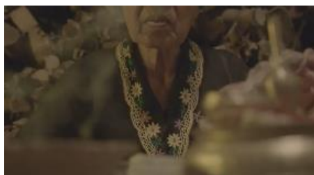
Gambar 4. 13 Visual dukun santet

Gambar diatas merupan narasumber ketua adat yang sedang menjelaskan tentang santet Banyuwangi dalam kehidupan masyarak Osing