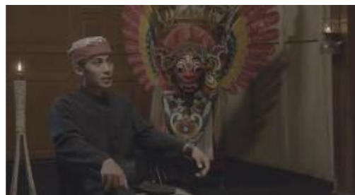
Gambar 4. 14 Visual pemain barong

teknik negosiasi kreatif untuk mendapatkan talent lansia, hal ini bertujuan agar penonton yang melihat semakin percaya dengan adanya ilmu santet di kehidupan masyarakat Banyuwangi.