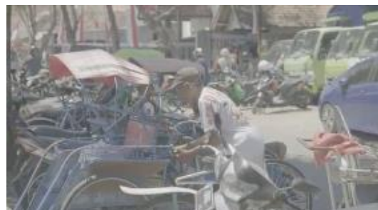
Gambar 4. 15 tukang becak

Rio prassetyo menceritakan bahwa dirinya sebagai pemain barong melakukan ritual sebelum pertunjukan berlangsung, dan ritual tersebut tidak boleh ditinggalkan.