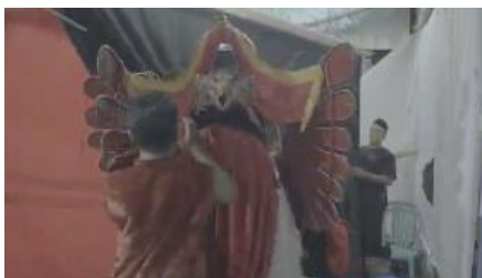
Gambar 4. 17 pemakaian atribut barong

Pada sequence ini pengembangan ide kreatif proses informasi cukup kompleks dan beragam. Hal ini terlihat dari banyaknya format yang digunakan seperti penyajian : Ilustrasi, wawancara, soundbite , hingga format voice over .