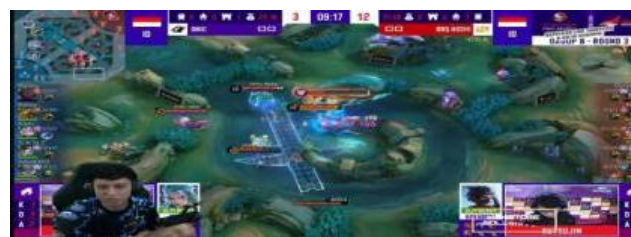
Gambar 6. Pengamanan area lord saat RRQ VS ONIC ID

Sementara itu, Lord adalah monster yang lebih kuat dan muncul setelah Turtle tidak lagi tersedia; jika dikalahkan, Lord akan membantu tim dalam menyerang markas lawan secara langsung, sehingga menjadi faktor penentu dalam kemenangan.