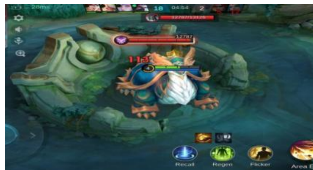
Gambar 5. Turtle

awal permainan dan memberikan keuntungan berupa pengalaman ( experience ) serta gold kepada tim yang berhasil mengalahkannya.