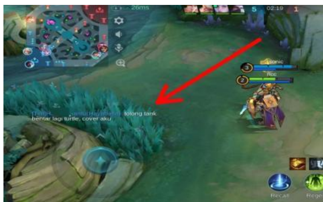
Gambar 4. Instruksi dari Jungle kepada tank untuk segera ke area turtle

Selain itu, hasil penelitian menunjukkan bahwa pola komunikasi satu arah atau instruksi linier sering kali muncul dalam situasi-situasi permainan yang bersifat genting dan menuntut kecepatan serta ketepatan eksekusi, seperti saat tim harus mengambil objektif besar yakni Lord atau Turtle .