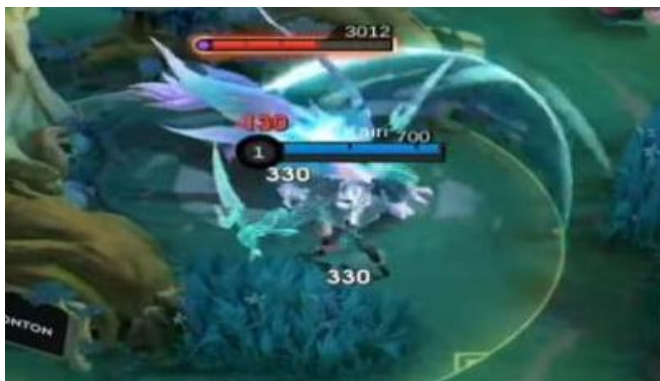
Gambar 1. Clear minion biru untuk mendapatkan kekuatan tambahan

Sementara itu, Tank berperan sebagai pelindung utama dalam formasi tim. Dengan kapasitas pertahanan yang tinggi dan daya tahan luar biasa, Tank memiliki tanggung jawab krusial untuk berada di garis depan pertempuran. Tugas utamanya meliputi melindungi rekan setim dari serangan musuh, menyerap damage sebesar mungkin, membuka inisiasi pertempuran melalui kontrol area atau crowd control, serta menciptakan ruang gerak aman bagi core atau damage dealer tim. Peran ini menuntut kesadaran posisi dan waktu yang sangat baik, karena satu kesalahan dalam eksekusi bisa berakibat fatal bagi keseluruhan strategi tim.