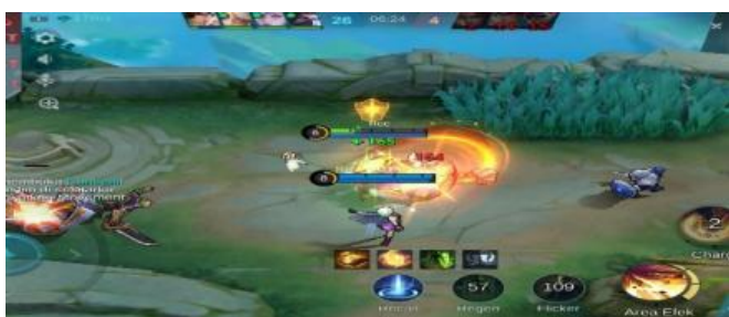
Gambar 2. Membantu marksman saat clear minion

Sementara itu, Tank berperan sebagai pelindung utama dalam formasi tim. Dengan kapasitas pertahanan yang tinggi dan daya tahan luar biasa, Tank memiliki tanggung jawab krusial untuk berada di garis depan pertempuran. Tugas utamanya meliputi melindungi rekan setim dari serangan musuh, menyerap damage sebesar mungkin, membuka inisiasi pertempuran melalui kontrol area atau crowd control, serta menciptakan ruang gerak aman bagi core atau damage dealer tim. Peran ini menuntut kesadaran posisi dan waktu yang sangat baik, karena satu kesalahan dalam eksekusi bisa berakibat fatal bagi keseluruhan strategi tim.