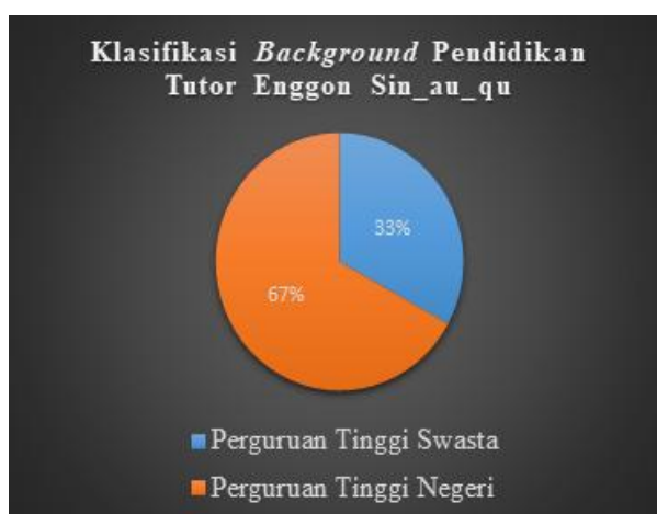
Gambar 3. Klasifikasi Background Pendidikan Tutor

Berdasarkan gambar 2, siswa bimbingan belajar Enggon Sin_Au_Qu terdiri dari 16% untuk jenjang TK yaitu sebanyak 13 orang siswa, 20% untuk jenjang SD yaitu sebanyak 17 orang siswa, 6% untuk jenjang SMP yaitu sebanyak 5 orang siswa, 29% untuk jenjang SMA yaitu sebanyak 24 orang siswa, 29% untuk jenjang UMUM yaitu sebanyak 24 orang siswa. Hingga saat ini bimbingan belajar Enggon Sin_Au_Qu memiliki tutor yang berjumlah 18 orang yang terdiri dari 10 orang berjenis kelamin perempuan dan 8 orang berjenis kelamin laki-laki yang berusia sekitar 23 hingga 31 tahun dengan background pendidikan lulusan dari Perguruan Tinggi Negeri dan Perguruan Tinggi Swasta. Berikut klasifikasi background pendidikan tutor Enggon Sin_Au_Qu.