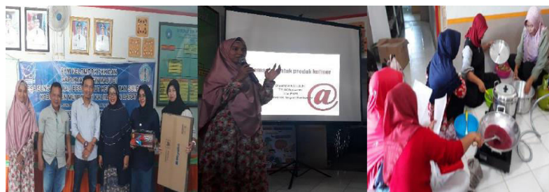
Gambar 5. Serah terima peralatan, penyampaian materi, dan pelatihan olahan produk