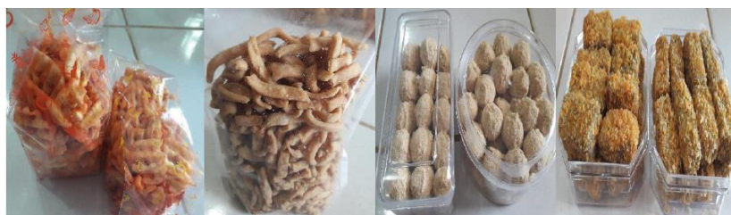
Gambar 2. Produk olahan buah pisang (jaring-jaring pisang, stick bawang, kue kering bawang dan nugget )