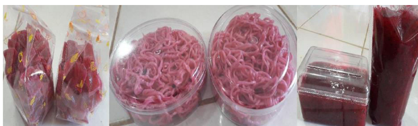
Gambar 1. Produk olahan buah naga (permen jelly , mie, selai naga)

Grafik 3 dan 4 memperlihatkan bahwa masyarakat mitra sangat tertarik terhadap produk olahan buah pisang dan naga, mitra telah memiliki kemampuan dan ketrampilan dalam membuat produk tersebut dan berusaha mengembangkannya sebagai peluang usaha yang dapat meningkatkan pendapatan keluarga. Produk jaring-jaring pisang aneka rasa dan kue kering bawang tepung pisang, stik bawang, permen jelly naga dan manisan kering naga menjadi produk inovasi yang menumbuhkan motivasi, semangat dan jiwa kewirausahaan mitra untuk berwirausaha secara sendiri maupun berkelompok.