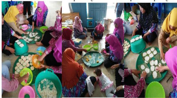
Gambar 3. Mitra mempraktekkan produk olahan jagung dan ubi kayu

Kegiatan PPM ini dapat dikatakan mengalami keberhasilan karena mendapatkan respon sangat memuaskan dari masyarakat mitra yang haus akan informasi, pengetahuan dan ketrampilan. Hal ini dapat dilihat dari tingkat kehadiran peserta 100% (dari 25 peserta) dan Semangat serta antusias mitra untuk mendapatkan inovasi baru dengan mengikuti setiap sesi kegiatan dari penyampaian materi sampai pelatihan produk. Adapun gambar aktifitas mitra pada kegiatan PPM ini dapat dilihat pada Gambar 3 .