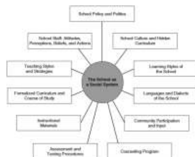
Gambar 2: seluruh lingkungan sekolah adalah sebuah sistem yang memuat faktor dan variable seperti budaya sekolah, peraturan, kurikulum. Dan seluruh factor dan variable tersebut harus dapat menciptakan serta merawat nilai-nilai multicultural. 20