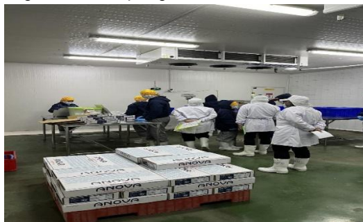
Gambar 5. Pengemasan dengan MC dan Pengkodean

Proses selanjutnya adalah pengemasan dengan MC (master carton) dan pengkodean. Ikan angoli beku dikemas dalam kemasan primer dengan menggunakan plastik polyethylene (PE), kemudian produk dikemas dengan MC sebagai kemasan sekunder. Tujuannya adalah untuk melindungi produk dari kerusakan fisik dan kontaminasi kimia serta biologi selama penyimpanan dan untuk memberikan informasi tentang produk, dan memberi pernyataan dan peringatan warning allergen kepada buyer. Prosedur proses pengemasan dengan MC yaitu dengan memastikan mutu produk sudah sesuai dengan standart dan mengemas produk sesuai dengan spesifikasinya. Hal ini sama dengan penelitian Zulfikar, (2016) pengemasan ini bertujuan untuk melindungi produk dari resiko kerusakan cacat fisik, mempermudah identifikasi produk, mempermudah distribusi dan juga memperindah penampilan dari pada produk. Pengemasan dengan MC dan pengkodean di PT. ILUFA dapat dilihat pada gambar