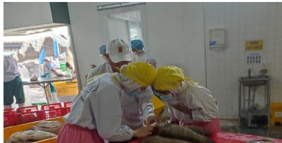
Gambar 2. Penerimaan Bahan Baku

Sebelum proses pembongkaran ikan, dilakukan pengecekan suhu terlebih dahulu oleh QC dengan menggunakan thermometer saku digital. Pengecekan suhu dilakukan dengan menusukkan ujung besi ke bagian anal ikan. Suhu optimal sebelum pembongkaran adalah 4, 4-5°C. Apabila suhu ikan kurang dari suhu optimal, maka dilakukan penambahan es selama proses penampungan. Hal ini sama berdasarkan penelitian Nasution & Martin, (2023), suhu ikan harus tetap dipertahankan 0 °C - 4,4 °C pada setiap tahapan proses. Penerimaan bahan baku di PT. ILUFA dapat dilihat pada gambar