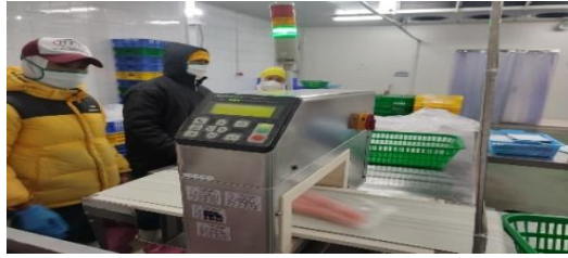
Gambar 4 Pendeteksi logam