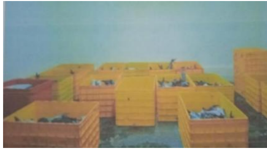
Gambar 3 Penampungan sementara

bahan baku datang ketika sore hari atau proses dihari itu tidak selesai, maka dilakukan penampungan sementara maksimal 1 hari. Hal ini sama berdasarkan penelitian Yusuf dkk., (2015) di PT. Maluku Prima Makmur, menunjukkan bahwa ikan yang telah dicuci di bagian penerimaan bahan baku, dimasukan ke dalam bak penyimpanan/penampungan sementara. Pengecekan suhu selama penampungan sementara dilakukan secara berkala yaitu setiap 2-3 jam sekali hingga ikan dibawa ke ruang proses. Suhu optimal bahan baku yaitu 4, 4,4-5 C. Apabila terjadi peningkatan suhu, maka dilakukan penambahan es dan pemantauan suhu oleh QC secara berkala hingga suhu bahan baku terpenuhi. Penampungan sementara di PT. Inti Luhur Fuja Abadi dapat dilihat pada Gambar 3