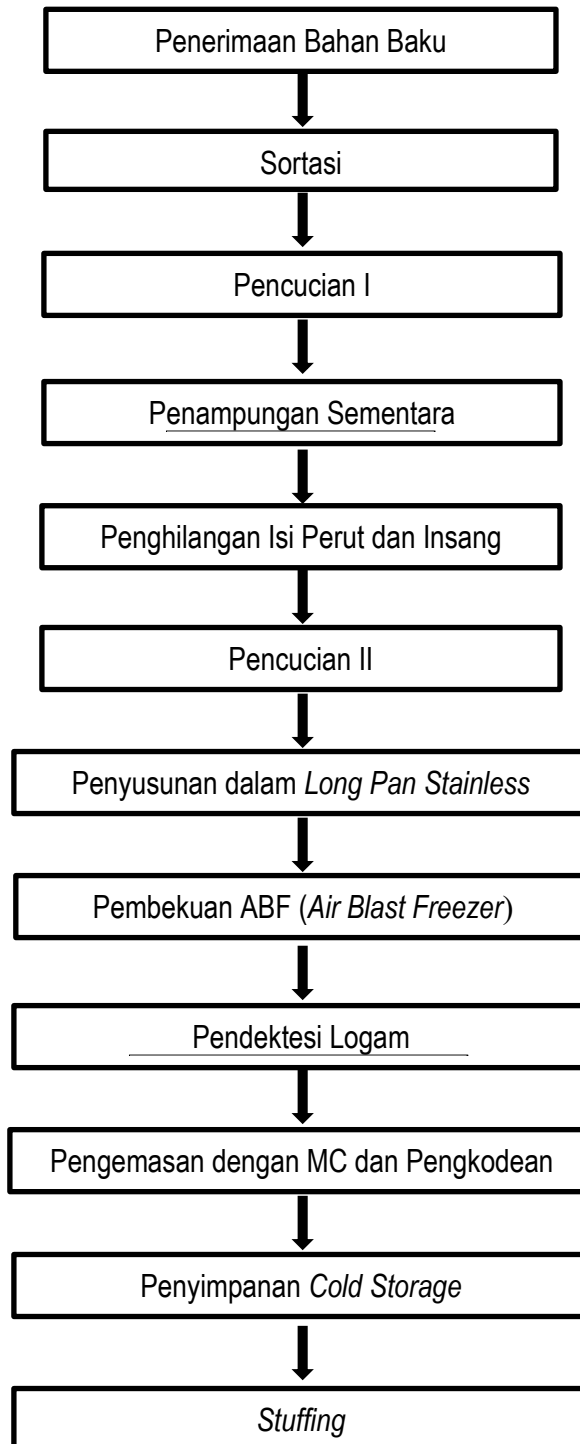
Diagram Alir Proses Pembekuan dan Pengemasan Produk ditunjukkan oleh Gambar 1