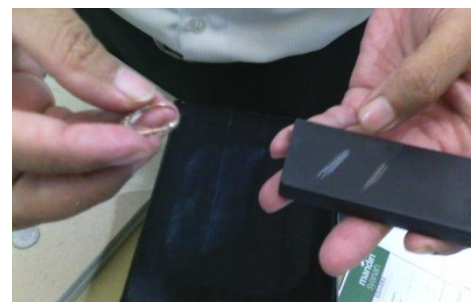
Uji Keaslian Emas