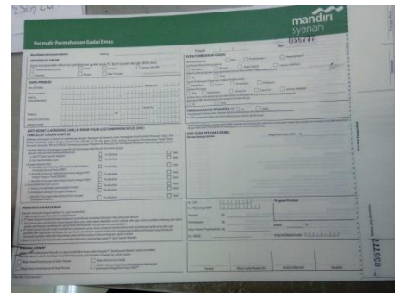
Formulir Gadai Emas