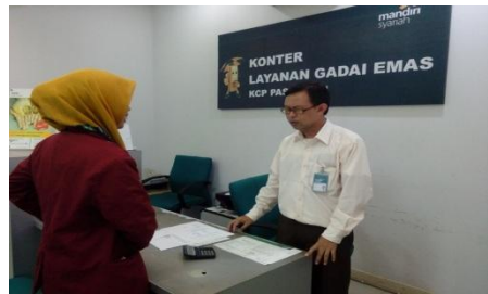
Simulasi Pengajuan Gadai Emas