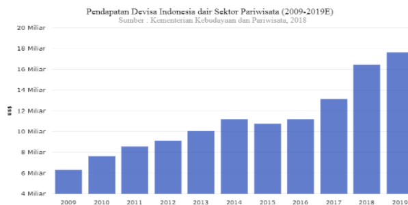
Gambar 2 Pendapatan Devisa Indonesia dari Sektor Pariwisata Tahun 2009-2019

industri halal yang ada di Indonesia yang masuk di dalam Masterplan Ekonomi Syariah. Keberadaan hotel syariah menjadi penting karena berkaitan dengan eksistensi pariwisata syariah yang membutuhkan berbagai sektor pendukung. Hotel syariah merupakan bagian pelayanan yang harus ada dalam pengembangan pariwisata halal untuk mengakomodir turis Muslim sehingga terjamin keamanan dan kenyamanan ketika harus menginap di tempat wisata. Sehingga hotel syariah juga bisa menjadi nilai tambah bagi pengembangan pariwisata halal. Pariwisata mempunyai kontribusi pada devisa negara yang dapat dilihat dalam grafik berikut ini: 36