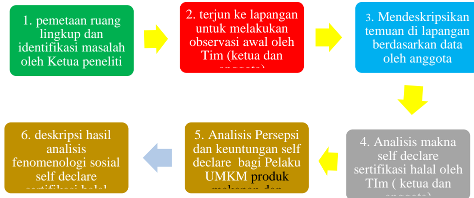
Gambar 3. Tahapan Penelitian

memahami makna self declare sertifikasi halal sehingga dapat meningkatkan awareness sertifikasi halal. Tahap- tahap penelitian dapat digambarkan dalam diagram alir berikut ini: