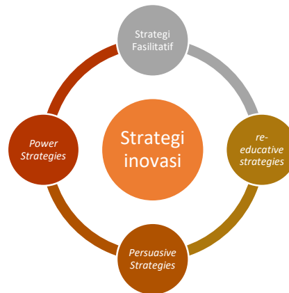
Gambar 3 Strategi inovasi