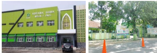
1.1 Dokumentasi asrama dan kelas siswa boarding MTs N 1 Pati

"Kalo dari segi pengelolaan, siswa boarding memiliki jadwal lebih padat daripada dengan siswa non-boarding. Dimana siswa non-boarding setelah jam pelajaran selesai, mereka langsung pulang kerumah. Sedangkan siswa non boarding berada diasrama selama 24 jam sehingga memiliki kegiatan lebih padat." 16