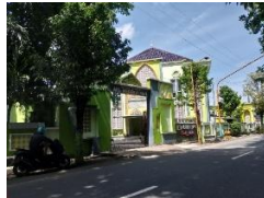
1.2 Dokumentasi kelas siswa non-boarding MTs N 1 Pati