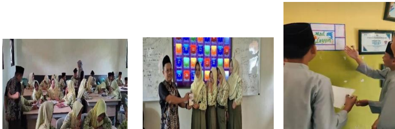
1.4 DOKumentasi pembelajaran Qur'an Hadist di kelas non-boarding