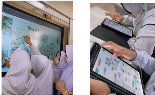
1.3 Dokumentasi pembelajaran SKI di kelas boarding

Pembelajaran PAI yang disertai dengan penguatan karakter keislaman di awal dan diakhir pembelajaran dapat mengembangkan karakter spiritual siswa. Selain itu model pembelajaran yang digunakan guru PAI MTs N 1 Pati termasuk dalam pendekatan Student Centered Learning (SCL). SCL merupakan pendekatan pembelajaran yang menitikberatkan pada peran aktif siswa dalam proses belajar. 22 Melalui pendekatan SCL, siswa diberikan ruang untuk mengonstruksikan pengetahuannya secara mandiri, sehingga mereka dapat memahami materi secara mendalam. 23