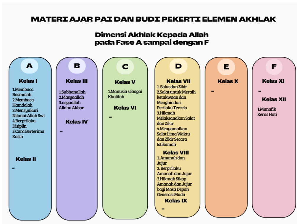
Gambar 2.1 Pemetaan Materi Ajar PAI dan Budi Pekerti pada Dimensi Akhlak Kepada Allah dari Fase A-F

Dari hasil telaah terhadap buku ajar PAI dan Budi Pekerti jenjang kelas I SD hingga kelas XII SMA yang diterbitkan oleh Kemendikbudristek tahun 2021-2022, diperoleh temuan bahwa materi terkait dimensi Akhlak kepada Allah umumnya terdapat di seluruh tingkat kelas atau fase, kecuali pada fase E, dan disajikan dengan penekanan pada pemahaman bertahap. Tahapan ini dimulai dengan pengenalan membaca Basmalah dan Hamdalah sebagai ungkapan untuk memulai kegiatan dan bersyukur kepada Allah. Selanjutnya, siswa diajarkan untuk mensyukuri nikmat, berperilaku disiplin, serta berterima kasih kepada Allah dan sesama, diiringi dengan pengucapan kalimat-kalimat pujian kepada Allah seperti Subhanallah, Masyaallah, Inshaallah, dan Allahu Akbar. Siswa juga diperkenalkan konsep manusia sebagai khalifah di bumi, kemudian membahas pentingnya salat dan zikir untuk meraih ketakwaan, dilanjutkan dengan pemahaman sikap amanah dan jujur serta menghindari sifat munafik dan keras hati. Untuk memperoleh pemahaman yang lebih mendalam mengenai materi ajar PAI dan Budi Pekerti pada elemen Akhlak dalam dimensi akhlak kepada Allah, dapat ditinjau melalui gambar berikut.