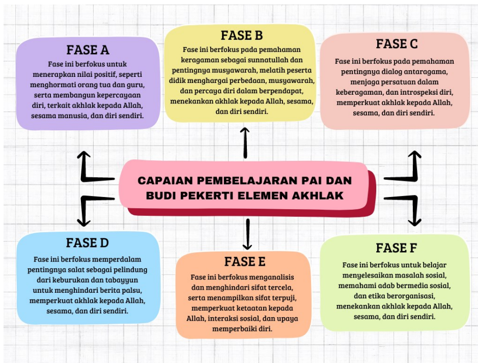
Gambar 1.1 Peta Capaian Pembelajaran PAI dan Budi Pekerti Elemen Akhlak

Berdasarkan kerangka konseptual Ibnu Miskawaih tentang trilogi akhlak (teosentris, antroposentris, dan egosentris), capaian pembelajaran (CP) elemen Akhlak dalam kurikulum PAI menunjukkan pola distribusi yang bervariasi. Pertama ; Dimensi Teosentris (Akhlak kepada Allah) Analisis dokumen kurikuler mengungkapkan bahwa; Dimensi ini terintegrasi secara implisit di hampir seluruh fase (A-D dan F) Terdapat missing link pada Fase E (kelas 10 SMA) dimana indikator akhlak teosentris tidak termanifestasi secara eksplisit. Implikasi pedagogis: perlu penajaman hidden curriculum untuk memastikan kontinuitas pembentukan sikap ketuhanan. Kedua ; Dimensi Antroposentris dan Egocentris. Kedua dimensi ini menunjukkan konsistensi yang lebih baik terkatinya muncul secara implisit di seluruh fase tanpa kecuali Pola penyebaran mengikuti prinsip scaffolding: Fase A-B: penekanan pada norma dasar interaksi, Fase C-D: pengembangan kesadaran sosial-kritis, Fase E-F: aplikasi dalam konteks kompleks. Temuan Kritis adalah Asimetri penguatan dimensi akhlak (72% teosentris vs 100% antroposentris-egosentris) Perlunya curriculum mapping untuk mengidentifikasi learning gap di Fase E, Ketimpangan ini berpotensi mempengaruhi keseimbangan pembentukan karakter. Berikut analisis pada tabel di bawah ini;