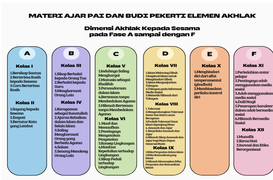
Bagan 3.1 Peta Materi Ajar PAI dan Budi Pekerti

Temuan kunci menunjukkan bahwa kurikulum telah memenuhi tiga prinsip pedagogis akhlak menurut Ibnu Miskawaih: (1) Takwīm al-khuluq (pembentukan karakter bertahap), (2) Ta'lim bi al-muhāsabah (pembelajaran melalui refleksi kritis), (3) Tahqīq al-wasatiyyah (pencapaian moderasi beragama). Implikasi pedagogisnya, model ini tidak hanya mengadopsi teori character building klasik tetapi juga merespons tantangan kontemporer seperti radikalisme, cyberbullying, dan disintegrasi sosial. Rekomendasi penelitian menyoroti perlunya penguatan link and match antara materi ajar dengan kasus-kasus aktual di masyarakat. Untuk memperoleh pemahaman yang lebih mendalam mengenai materi ajar PAI dan Budi Pekerti, khususnya pada elemen Akhlak dalam dimensi akhlak terhadap sesama, perhatikan bagan berikut ini.