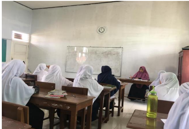
Gambar 1. Proses kegiatan belajar mengajar di Pondok Tahfidz Hidayatul Qur'an

Dari tabel diatas mendapatkan nilai cronbach apha sebesar 72,1% maka dapat kita simpulkan bahwa cronbach alpha > 0,60 maka tingkat reabilitas dinyatakan baik. 21