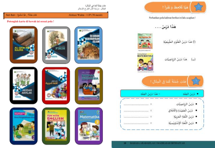
Gambar 9. Media kartu