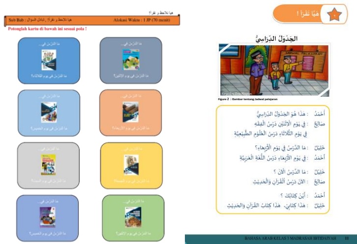
Gambar 7. Media kartu