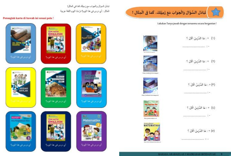
Gambar 8. Media kartu

Peserta didik melakukan tanya jawab secara bergantian dengan team sebangkunya