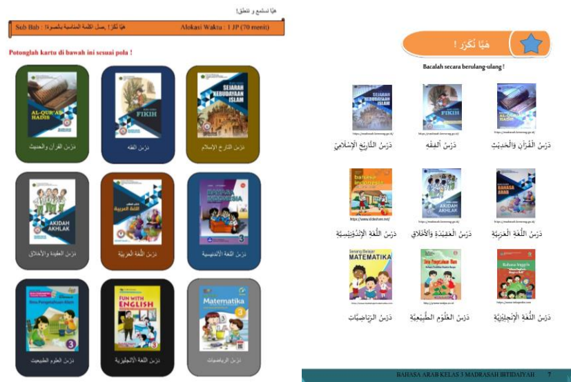
Gambar 5. Media kartu