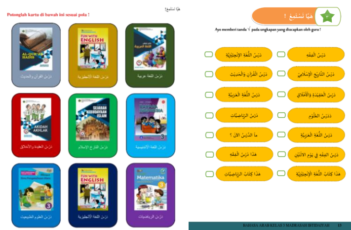
Gambar 10. Media kartu