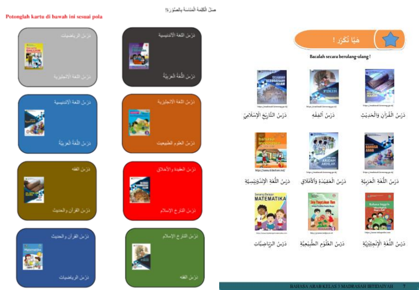
Gambar 6. Media kartu