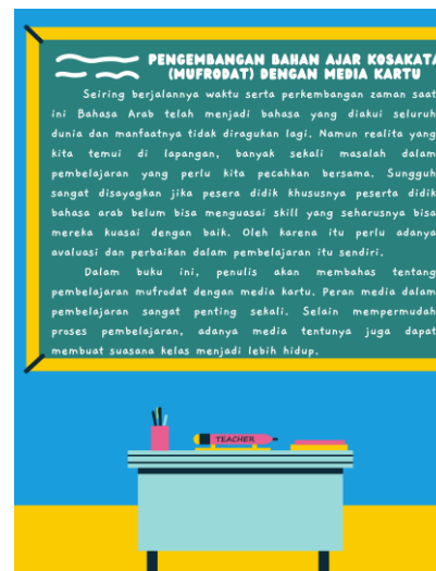
Gambar 4. Cover Belakang Buku

Selanjutnya, peneliti mulai menyusun media kartu yang akan digunakan dalam pembelajaran ini. Kartu permainan ini didesain dengan ukuran 2R dengan berbagai macam pilihan warna yang menarik. Kemudian peneliti menambahkan beberapa gambar ke dalam kartu permainan agar lebih menarik minat peserta didik. Kartu Permainan ini beragam jenisnya. Namun yang peneliti gunakan disini ada 6 jenis kartu permainan yaitu: