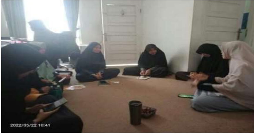
الصورة 2: تقسيم المجموعة يجب على المعلم تقسيم التلميذات إلى مجموعات صغير يتكون من إثنان أو أكثر

تنفيذ نموذج التعلم التعاوني لتحسين مهارة الكلام في إنسان جنديكيا العالية الإسلامية باياكمبوه