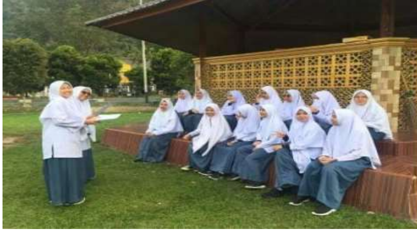
الصورة 3: تقسيم التلميذات إلى مجموعات صغير تتألف من 3-5 أفراد متفاوتي القدرة التحصيلية

كما رأت الباحثة أسلوب البيانات من عملية التعلم التعاوني البرنامج اللغوي مهارات الكلام في المسكن يجرى بالطيب في كل يوم إلى يوم العطلة بعد ذلك ينقسم التلاميذة في المجموعتين ويقوم بإعداد نوعين من البطاقات، وهما الأسئلة والإجابة ثم ناشد المعلم على التلميذات قراءة المادة التالية ومناقشتها في المسكن ثم تحصل التلميذات من حفظ المادة الحوار و يمارسها مع الأصدقاء.