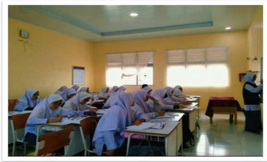
الصورة 1: يعطى المعلم تعليمات للمدرس حول كيفية الاقتراب الأصدقاء من حيث فهم المادة