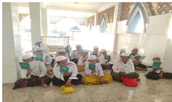
Gambar 2: Proses pembelajaran KLB

Penerapan KLB di Madin Ar-Rofi'iyah diintegrasikan ke dalam rutinitas harian dan mingguan. Siswa diwajibkan membaca KLB sebelum masuk kelas setiap hari untuk mempersiapkan diri dan meningkatkan pemahaman Bahasa Arab. Selain itu, pada malam Kamis, siswa diwajibkan menyetorkan hafalan mufrodat yang telah dipelajari selama seminggu, dengan batasan 7 bait. Proses ini tidak hanya memperkuat hafalan, tetapi juga meningkatkan kemampuan membaca dan memahami Bahasa Arab. Dalam proses setoran, guru juga mendorong siswa untuk saling melanjutkan pembacaan KLB, yang membantu meningkatkan kemampuan membaca, pemahaman, serta memupuk rasa percaya diri dan kerja sama. Murojaah (pengulangan) KLB yang sudah dihafalkan juga ditekankan untuk mempertahankan hafalan dan meningkatkan kemampuan penggunaan Bahasa Arab dalam berbagai konteks.